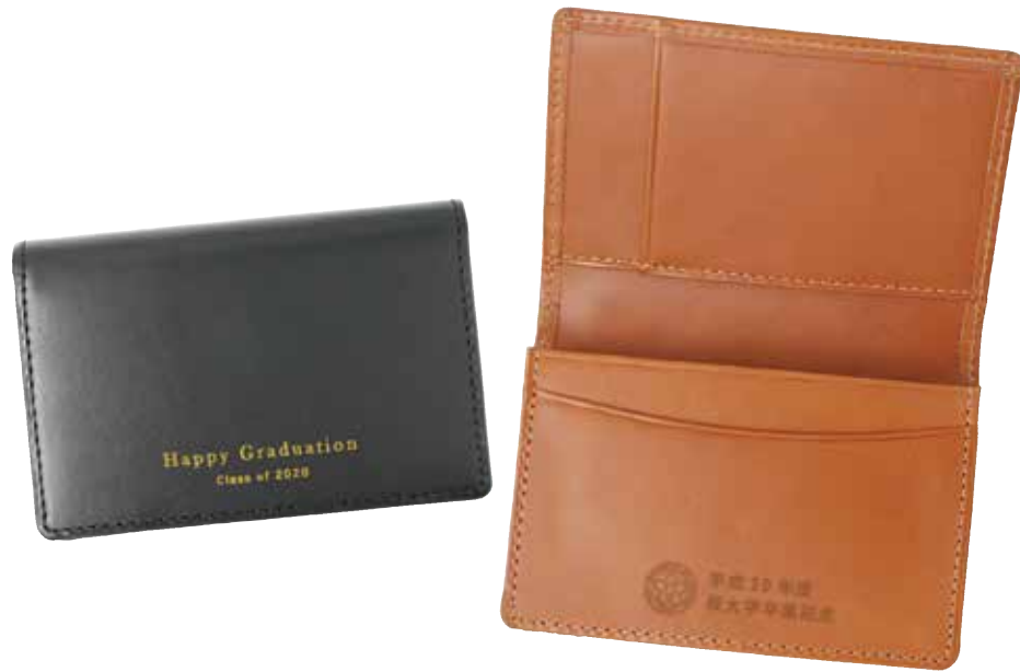
Rio 通しマチ名刺入れ ¥4,500(税抜き) H76×W111×D20mm