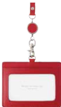
Rio リール付きIDストラップ ¥5,800(税抜き) 本体：H93×W105×D5mm ストラップ：H490×W21×D9mm