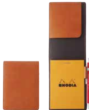
Rio RHODIA メモカバー#11 ¥3,500(税抜き) 木軸ボールペンS ¥350(税抜き) H115×W83×D15mm W107mm×φ8