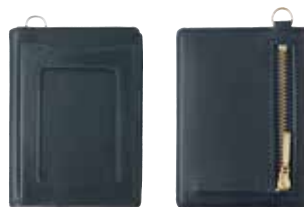
Rio パスコインケース ¥5,900(税抜き) H100×W75×D16mm