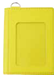
ノワール バスコインケース ¥3,500 (税抜き) H101×W77×D16mm