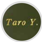
・個人名イメージ