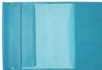
ノワール フリータイプ文庫判ブックジャケット ¥3,500 (税抜き) H165×W240×D4mm