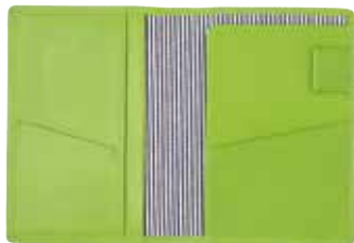
ノワール パスポートケース ¥3,600 (税抜き) H140×W208×D6mm