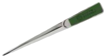
Rio レターオープナー ¥1,500(税抜き) H170×W20×D5mm