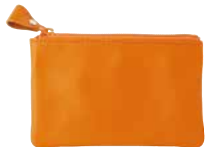
ノワール P ポーチ S ¥1,500 (税抜き) H78×W118×D7mm