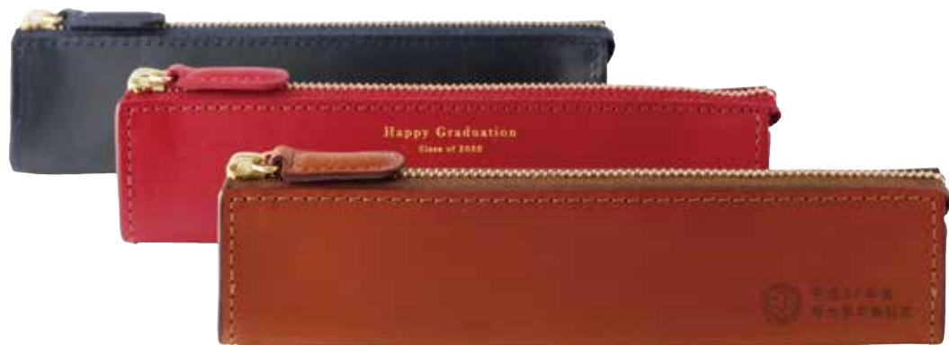
Rio ファスナーペンケース S ¥2,900( 税抜 ) H45×W170×D30mm